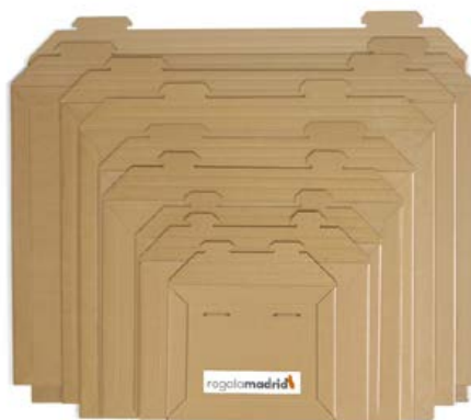
Sobres rígidos con cierre de seguridad