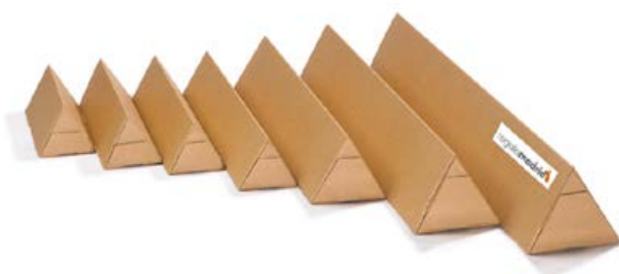
Cilindros rígidos de sección triangular

Las copias se entregan, dependiendo del tamaño y de las características de la producción, en embalajes rígidos que garantizan la integridad de la obra en su transporte y almacenamiento. Pueden ser sobres rígidos, tubos de cartón de sección triangular u otros sistemas en función del tamaño de las calidades empleadas.