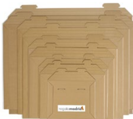
Sobres rígidos con cierre de seguridad