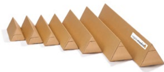
Cilindros rígidos de sección triangular

Las copias se entregan, dependiendo del tamaño y de las características de la producción, en embalajes rígidos que garantizan la integridad de la obra en su transporte y almacenamiento. Pueden ser sobres rígidos, tubos de cartón de sección triangular u otros sistemas en función del tamaño de las calidades empleadas.